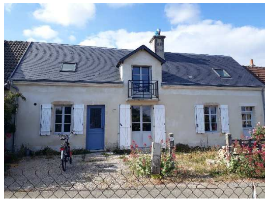
Eco-Maison de village (100 m 2 / 4 p) disponible à la location pour les porteurs de projet