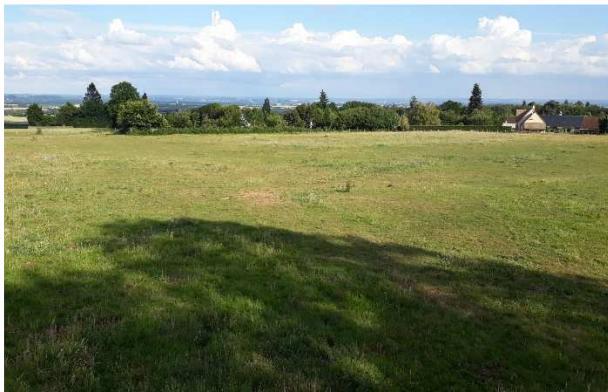
Terrain proposé : 1.5 ha actuellement en prairie, partiellement entouré de haies et dominant le Perche

Le site est idéal pour un projet associant maraîchage sur sol vivant, quelques poules pondeuses et à terme, arboriculture biologique. Nous savons d'expérience que ce type de projet est plus simple à réaliser à deux mais il pourrait commencer avec un seul porteur de projet. Un puits existe à 50 m du site et pourra être utilisé pour l'irrigation.