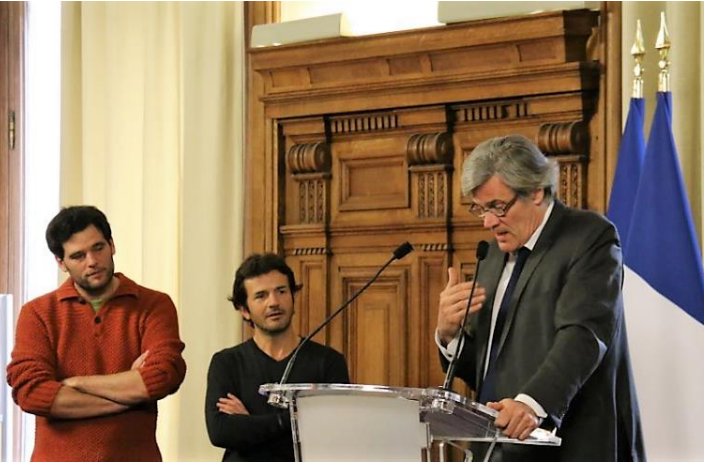
Stéphane Le Foll, au Ministère de l'Agriculture lors de la remise des prix du Concours Arbres d'Avenir en janvier 2016

34 LAURÉATS, 3 GRANDS GAGNANTS, 200 000 € DE DOTATIONS, 40 000 ARBRES PLANTÉS EN FRANCE, 200 PARTICIPANTS À LA REMISE DES PRIX AU MINISTÈRE DE L'AGRICULTURE, 1 GRANDE VICTOIRE POUR L'AGROÉCOLOGIE.